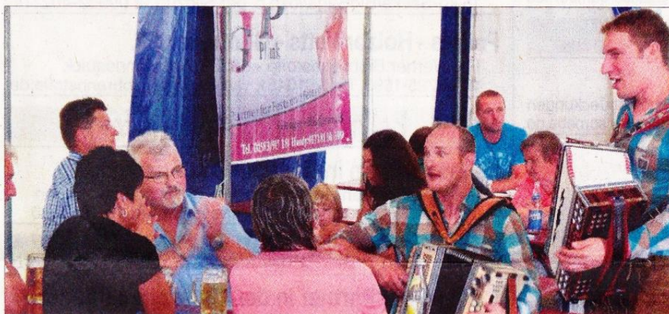
„Fetzad Boarisch“ spielten für die Gäste auf.